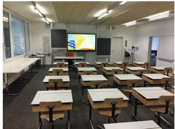
Das neue Klassenzimmer im Pavillon

Der Gemeinderat stimmte diesem Vorschlag grundsätzlich zu. Im Pavillon wurde ein neues Klassenzimmer eingerichtet. Seit Schuljahresbeginn wird darin die 3. Klasse unterrichtet.