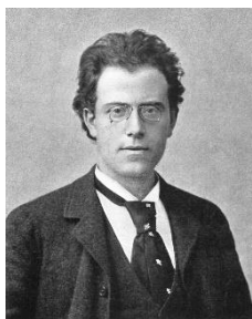
Gustav Mahler (1892)

Gustav Mahler (* 7. Juli 1860 in Kalischt, Böhmen, † 18. Mai 1911 in Wien) war ein österreichischer Komponist im Übergang von der Spätromantik zur Moderne. Er war nicht nur einer der bedeutendsten Komponisten der Spätromantik, sondern auch einer der berühmtesten Dirigenten seiner Zeit und als Operndirektor ein bedeutender Reformier des Musiktheaters.