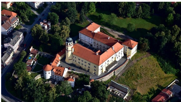
Schloss Vlašim, Luftaufnahme (2018)

Vlašim-Tor kann man eine Galerie und in der Alten Burg eine Sammlung von Gravuren, die den historischen Park zeigen, besuchen. Durch den Park führt ein 3 km langer Lehrpfad über die Sehenswürdigkeiten von Vlašim und Umgebung.