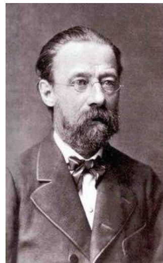
Porträtfoto von Bedřich Smetana (ca. 1878)

Interessant war auch die Führung im Geburtshaus von Bedřich Smetana (* 2. März 1824 als Friedrich Smetana in Litomyšl, † 12. Mai 1884 in Prag). Er war ein tschechischer Komponist der Romantik. Sein bekanntestes Werk ist «Die Moldau» (Vltava) aus dem sinfonischen Zyklus «Mein Vaterland» (Má vlast).