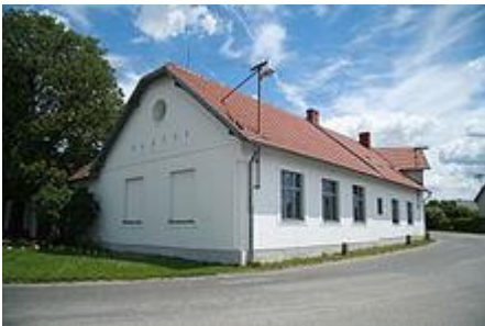
Gustav Mahlers Geburtshaus

Ein feines Nachtessen gab es in der Pension Gustav Mahler in Kaliště, eine Gemeinde sieben Kilometer nordwestlich von Humpolec in der Böhmischemährischen Höhe und gehört zum Bezirk Pelhřimov. Das Dorf Kaliště ist der Geburtsort des Komponisten und Dirigenten Gustav Mahler, der in einer jüdischen Familie zur Welt kam. In den 1930er Jahren brannte das am Ortsrand gelegene Geburtshaus des Komponisten ab, wurde jedoch in der letzten Zeit von der tschechischen Gustav Mahler Gesellschaft (Společnost Gustava Mahlera MAHLER 2000) restauriert. Das Haus beherbergt eine ständige Ausstellung mit dem Thema "Mahler und Böhmen".