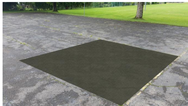
Ein einheitliches Gesamtbild und Schutz gegen die weitere Auflösung der Oberfläche.