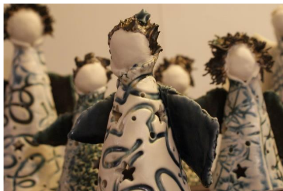
Steinzeug und Porzellan prägen die Arbeiten der Künstlerinnen