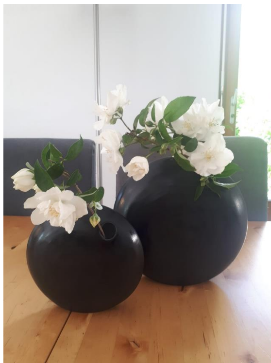
Neue Formen und Farben zeichnen ihre Arbeiten aus

Die beiden werden den Betrieb selbständig im Nebenerwerb führen. Beide arbeiten zusätzlich im agogischen Bereich und beide haben auch Familie. Es wird keine fixen Ladenöffnungszeiten geben. «Wenn wir vor Ort sind, ist die Türe offen», lacht Daniela Christen Widmer. Die beiden freuen sich riesig auf das neue gemeinsame Projekt. Sie planen nun an der neuen Website und an einem Kursangebot für Interessierte.