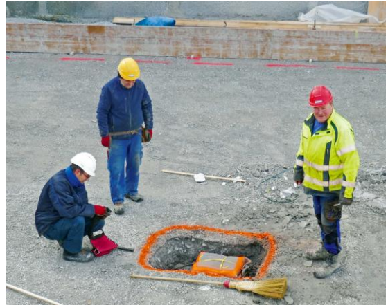
Die Dokumentkiste wird vergraben