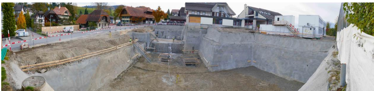
Die fertige Baugrube am 22. Oktober 2020 mit den Öffnungen für Lift- und Pumpenschacht

Der Aushub verlief zügig. Die im Vorfeld ausgeführten geologischen Untersuchungen bestätigten die Erkenntnisse und Einschätzungen. Im ganzen Turnhallen- und teilweise im Schutzraumbereich lag Moränenkies. Das konnte gut ausgebagert und als wiederverwertbares Material abgeführt werden. Einzig im Bereich des neuen Schutzraumes traf man auf nagelfluhähnlichen, harten Untergrund, welcher mit entsprechend stärkeren Geräten abgebaut werden konnte. Sicherlich waren die zusätzlichen Immissionen in der näheren Umgebung gut bemerkbar. Herzlichen Dank hier für das entgegengebrachte Verständnis. Parallel zu den Aushubarbeiten wurde auch die Baugrubensicherung (Nagelwand zur Sicherung vor dem Einsturz) und die Unterfangung des Stöckli erstellt. Trotzdem konnten die Aushubarbeiten termingerecht abgeschlossen werden.