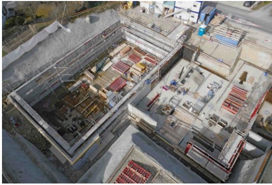
Blick von der Kranführerkabine aus