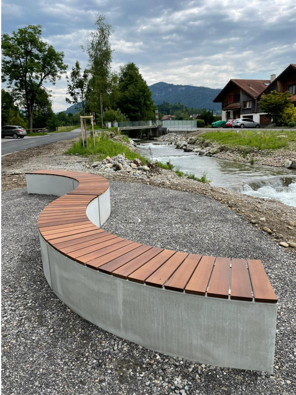
Wellenbank "Bachmätteli" – Geschenk des Frauenvereins Kiesen-Oppligen (siehe Seite 9)

Informationsblatt der Einwohnergemeinde Kiesen