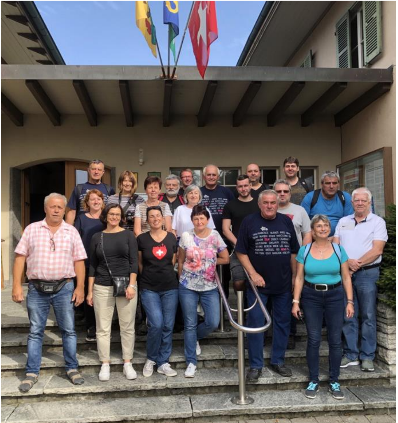
Gäste aus der Partnergemeinde Želiv (Tschechien)

Informationsblatt der Einwohnergemeinde Kiesen