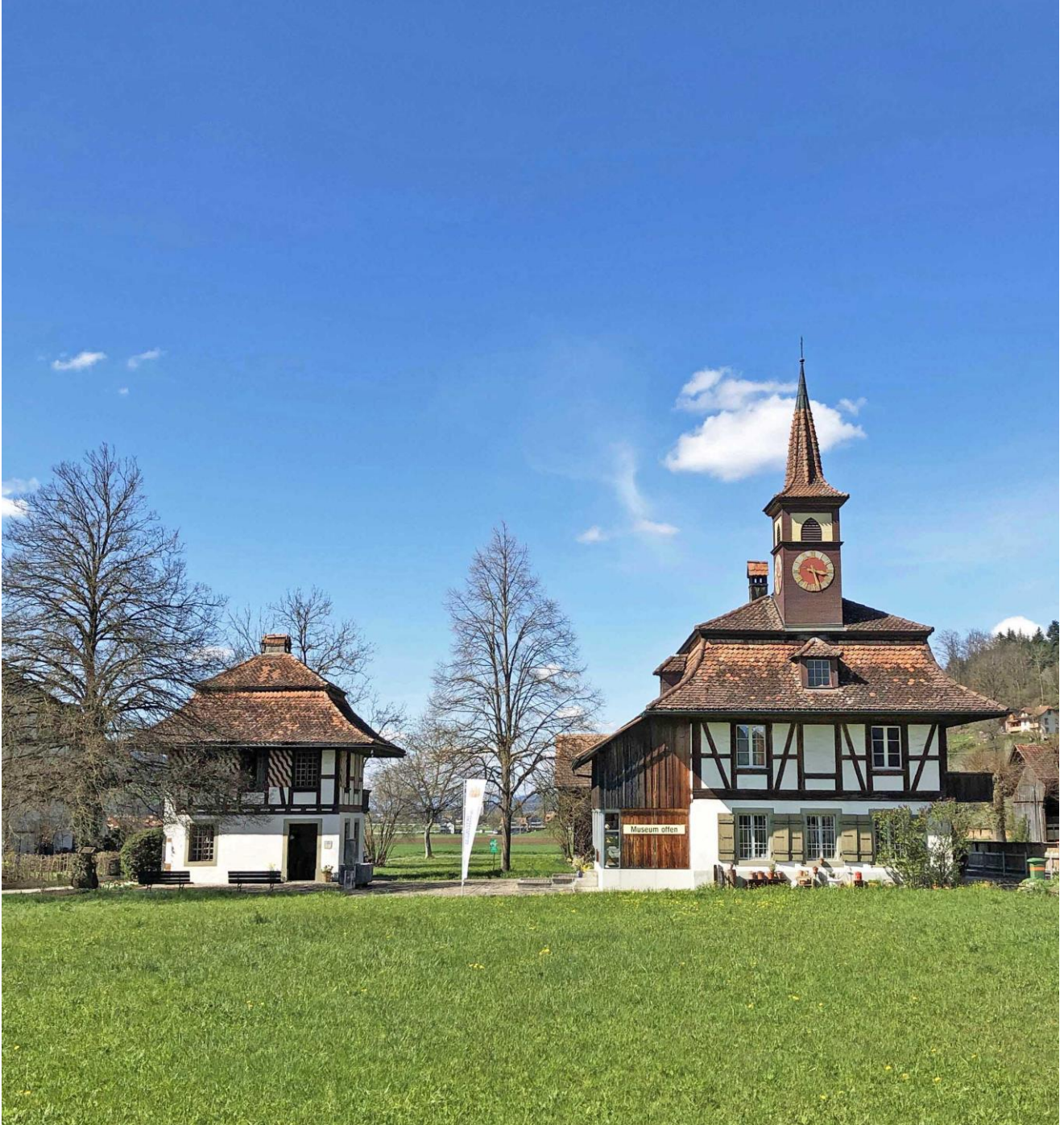
Nationales Milchwirtschaftliches Museum Kiesen (Bericht Seite 11)

Informationsblatt der Einwohnergemeinde Kiesen