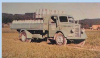
Milchtransporte seit 1946 - Firma Rolli, Gassel BE

Industrialisierung und Urbanisierung führten zu einer Konzentration der Bevölkerung in grösseren Dörfern und in Städten. Deren tägliche Versorgung mit Milch als einem wichtigen, aber auch verderblichen Grundnahrungsmittel musste gesichert werden. Die Ausstellung zeigt die Entwicklung von Milchtransport und Milchezustellung. Die Geschichte der Organisation des privaten Milchhandels in den Städten mitsamt seinen sozialen Aspekten wird dargestellt. Auch die Rahmenbedingungen zur Mengenerfassung und Bezahlung der Milch werden berücksichtigt.