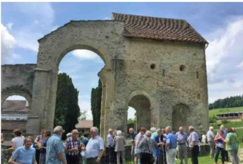
Apéro Ruine Rüeggisberg 2017

Bitte Datum reservieren, persönliche Einladung folgt