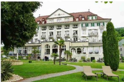
Parkhotel Gunten 2019