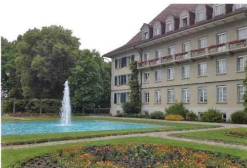
Kant. Gartenbauschule Oeschberg 2016