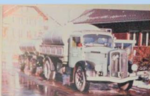
Erster Milchtanklastwagen in der Schweiz 1963