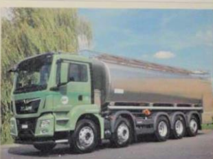
Milchsammelfahrzeuge im Lauf der letzten 80 Jahre