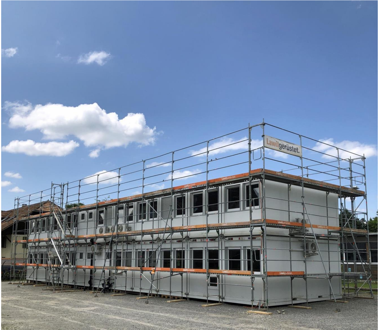
Schulraumprovisorium im Bau

Informationsblatt der Einwohnergemeinde Kiesen