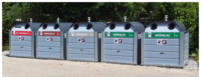
Container der AVAG

Der Gemeinderat bewilligt für den Ersatz der Sammelbehälter einen Kredit von rund 6'700 Franken. Die jährlichen Betriebskosten für Abfuhr und Entsorgung bleiben im bisherigen Rahmen.