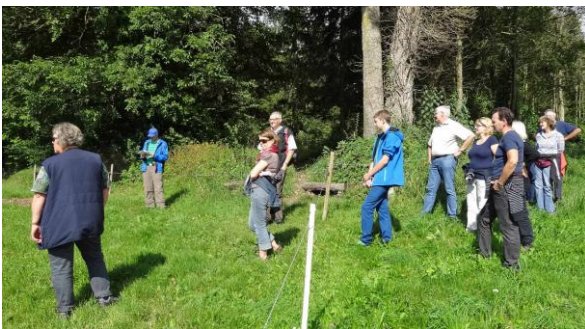
Bilder von der Grenzbegehung